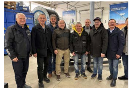
FCG PRO-GE Landesvorstand Steiermark

Unter dem Punkt Allfälliges wurden abschließend noch verschiedene organisatorische und aktuelle Themen angesprochen. Die Sitzung endete mit einem positiven Ausblick auf die kommenden Monate und dem gemeinsamen Ziel, die Interessen der Arbeitnehmerinnen und Arbeitnehmer in der Steiermark weiterhin engagiert und geschlossen zu vertreten.