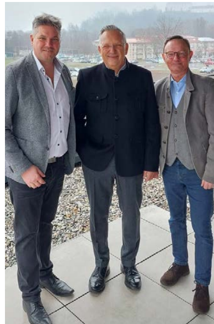
Pendler austausch mit Bürgermeister Karl Lautner

Abschließend waren sich die Gesprächspartner einig, dass es das Ziel sei, konkrete Verbesserungen für die Pendlerinnen und Pendler auf den Weg zu bringen und die Bahnverbindung nach Bad Radkersburg zukunftsfit zu machen.