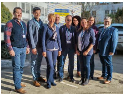
LVer Landwirtschaftslehrerinnen und -lehrer